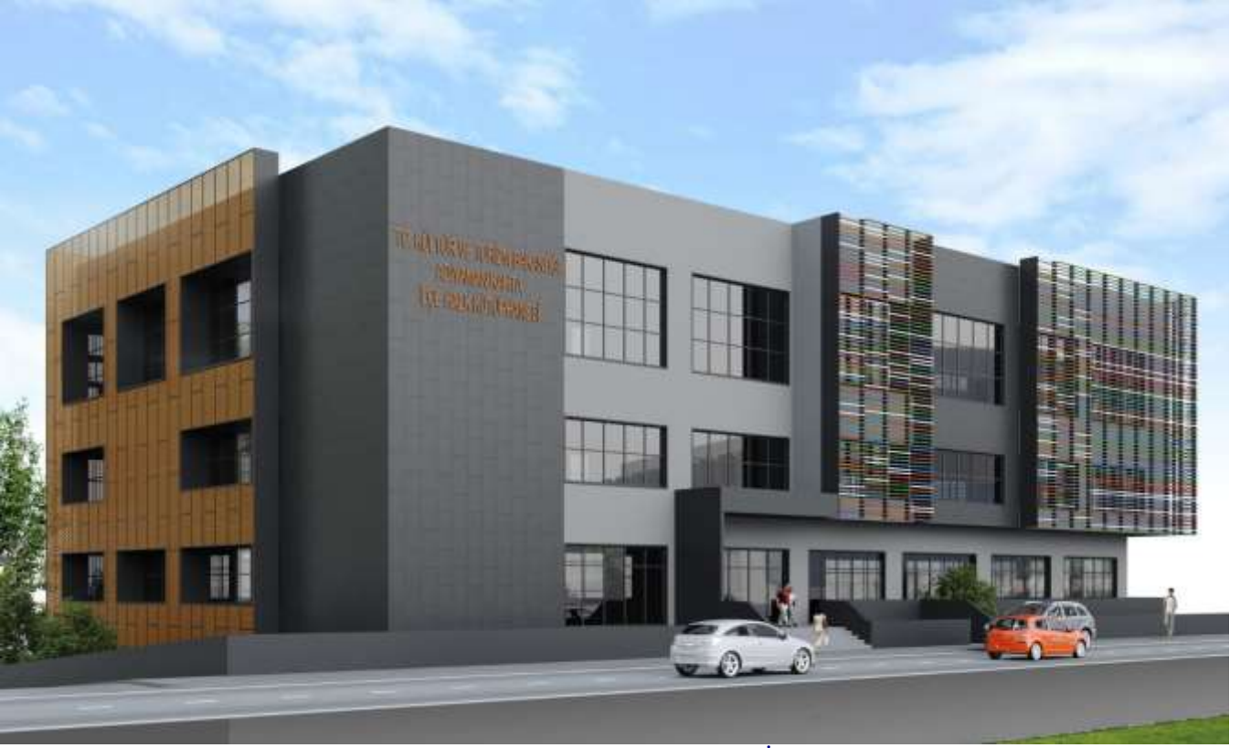
Kahta Halk Kütüphanesi Projesi (İhale aşamasında)