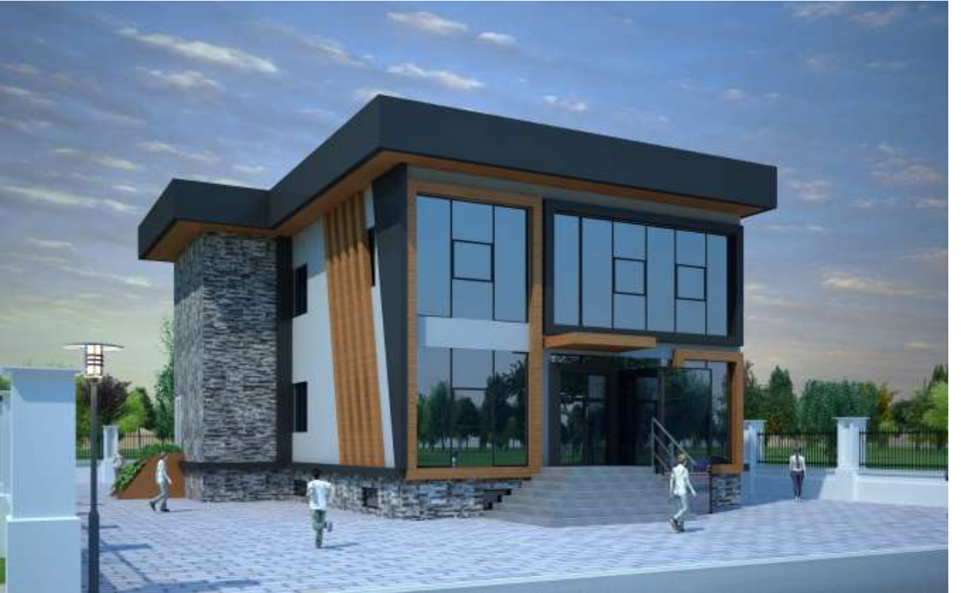
Merkez Yeşilyurt mahallesi halk kütüphanesi projesi (Proje aşamasında)